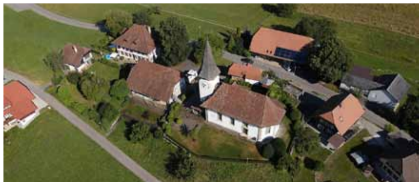
Kirche Grafenried von oben.

Ob und wie und mit welchen Einschränkungen oder Alternativen diese Gottesdienste gefeiert werden können, ist weiterhin nicht ganz klar. Beachten Sie bitte den Anzeiger in der Woche vorher. Danke!