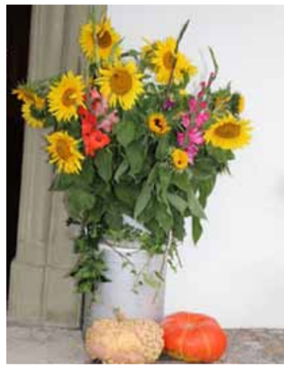
Blumenschmuck zum Erntedank