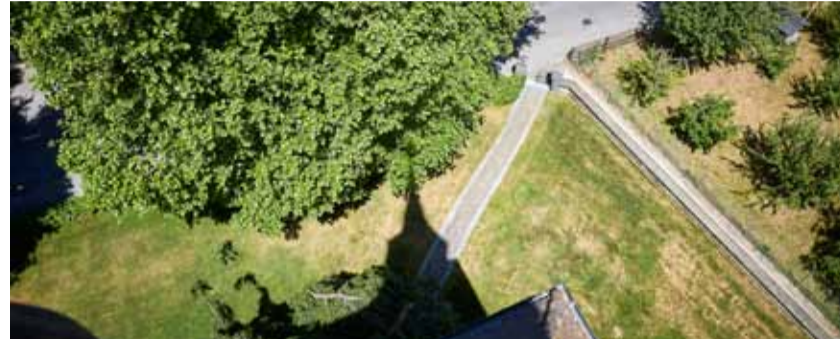
Blick aus dem Turm der Kirche Utzenstorf.

Und kaum hatte sich die Gruppe etwas beruhigt, die Machtkämpfe etwas geklärt, kam einer, der kannte