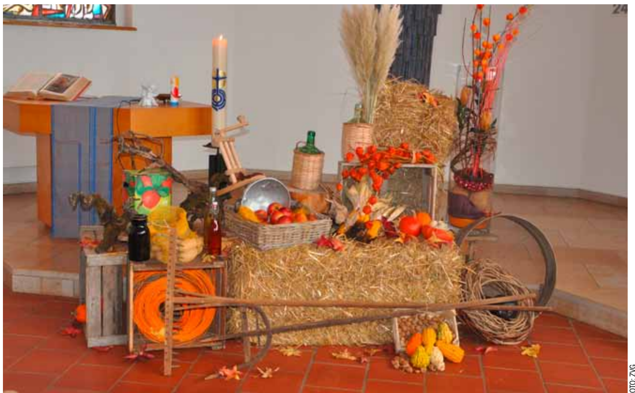
Schmuck in der Kirche zum Erntedank